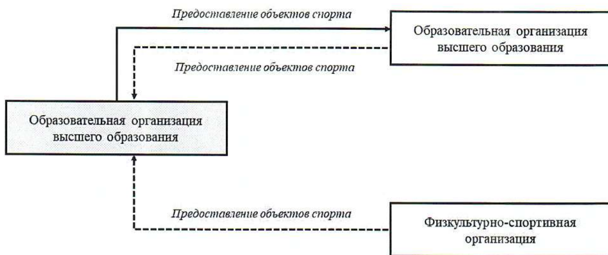
Рис. 1. Механизм коллективного использования объектов спорта

В рамках коллективного использования объектов спорта образовательная организация может осуществлять взаимодействие с иной образовательной организацией и (или) физкультурно-спортивной организацией, которая имеет возможность предоставлять объекты спорта в коллективное использование, для организации занятий физической культурой и спортом обучающимися.